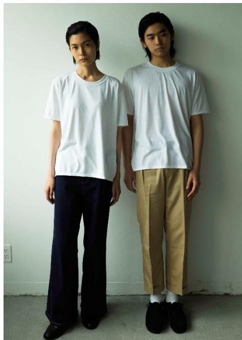
◀ BRING T-shirt Basic DRY ¥4,300(税抜)

▼ WUNDERWEAR 50/50 ¥3,400 (税抜) 70/30 ¥3,800 (税抜)