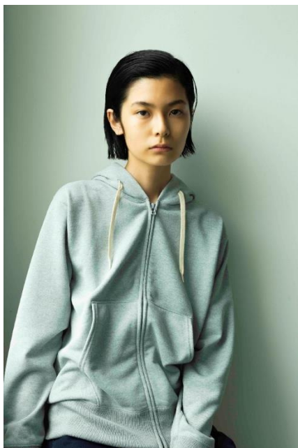
▲ DRY Sweat Zipup Hooded Jacket ¥12,300(税抜)