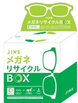
リサイクル BOX サンプル画像

ジンスはアイウェアビジネスのリーディングカンパニーとして、年々高まりを見せるお客様の環境意識に耳を傾け、より多くのお客様に支持される新たなアイウェアカルチャーの創造に努めてまいります。